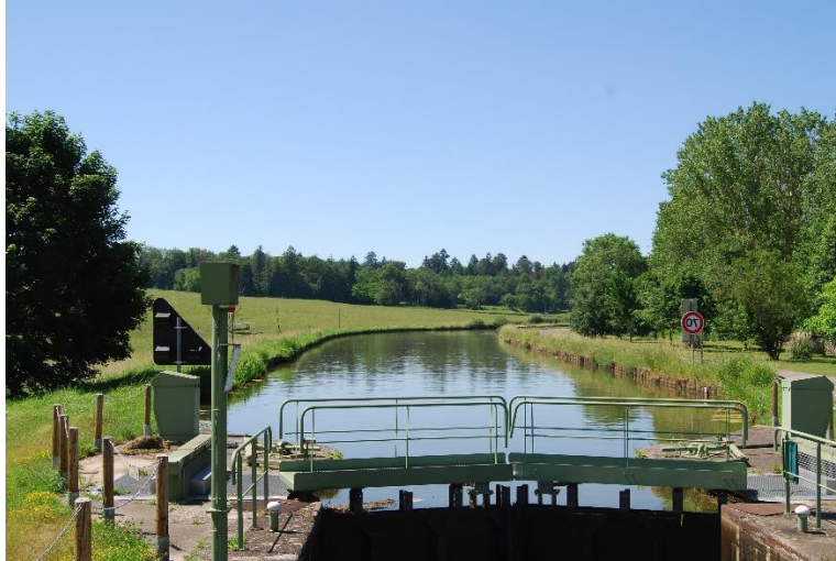
Canal du Centre

Tag 3: Fahrt Montchanin bis Génelard , 13 km, 16 Schleusen, Fahrzeit 8 ½ Std. Wasserstrasse: Canal du Centre Besonderes: Sehr schöne und ruhige Anlegestelle mit Strom und Wasser (kostenlos). In Ortschaft nur Bäckerei, kleine Bar und Tabakladen