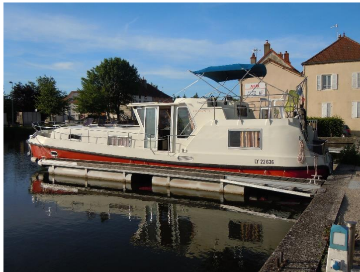
St. Léger s/Dheune

Besonderes: Wunderschöne Fahrt durch das Weingebiet des Burgunds. Festmachen an der Basis von Locaboat, welche in diesem Jahr aufgrund der Coronapandemie geschlossen ist. Kein Wasser, kein Strom, weil Basis geschlossen. In St. Léger alle Einkaufsmöglichkeiten und Restaurant.