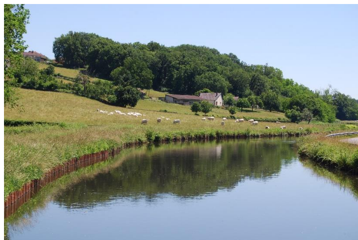
Canal du Centre

Besonderes: Anlegestelle sehr weit von Stadt entfernt. Angenehme Anlegestelle ohne Strom und Wasser. Unterwegs in St. Julien Wasser getankt.