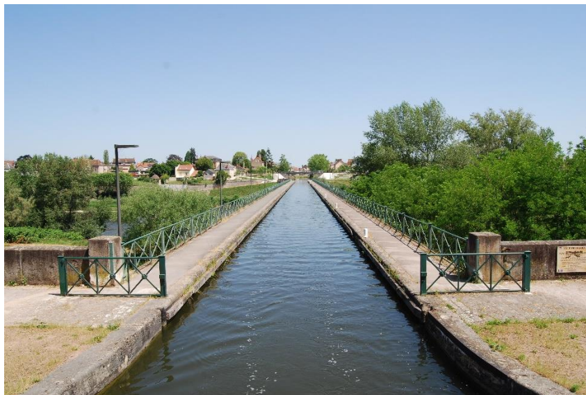
Aquädukt Digoin über die Loire