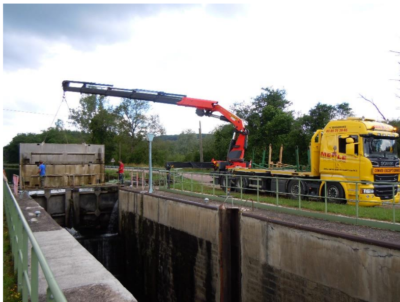
Schleuse 10 defekt

Besonderes: In St. Julien sehr schöne und ruhige Anlegestelle mit Strom und Wasser kostenlos. In Ortschaft keine Einkaufsmöglichkeiten, keine Restaurants. infolge Defekt an der Schleuse 10 (Holz verkeilt im Schieber) werden wir in St. Julien blockiert. Reparatur der Schleuse bis am Folgetag 14.00 Uhr.