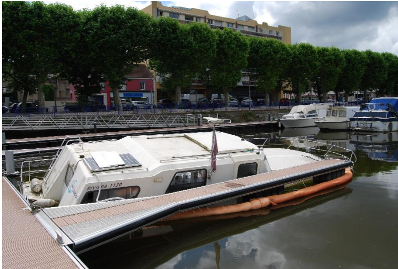
... will nicht mehr schwimmen...